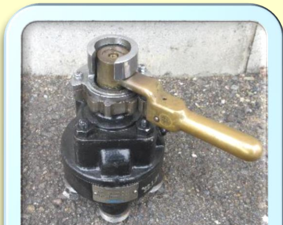
ブレーキ弁 ハンドル付

※1 終了時刻は予定です。終了10分前から終了までに入札があった場合、終了時刻が自動的に10分間延長されます。