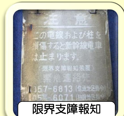
限界支障報知装置注意看板