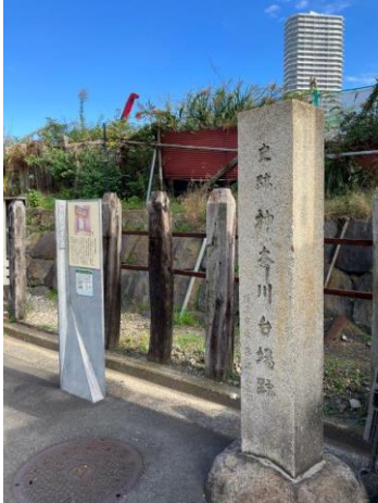
神奈川台場跡碑(星野公園)

【主な史跡】 東神奈川駅基礎の煉瓦積み、瑞穂橋、神奈川台場跡碑(星野公園)、神奈川本陣跡地(竜の川)、旧東海道神奈川宿(宮前商店街)、幸ヶ谷公園、青木橋、旧高島山トンネルほか